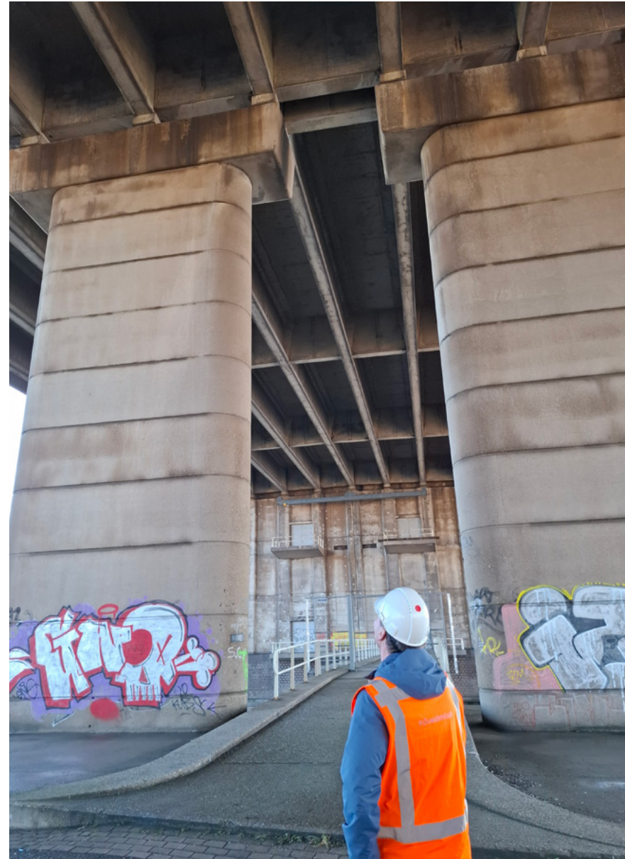
Werkbezoek in het kader van onderzoek naar de vernieuwing van de Van Brienoordbrug.

In 2025 hebben we twintig adviezen en één naschrift uitgebracht. De tabel op de volgende pagina geeft een overzicht van deze adviezen en het naschrift, het meest recente advies staat bovenaan. De ICT-projecten zijn onderzocht na aanmelding door het verantwoordelijke ministerie. Het begrote ICT-budget voor de projectuitgaven bedraagt in totaal meer dan 1,1 miljard euro.