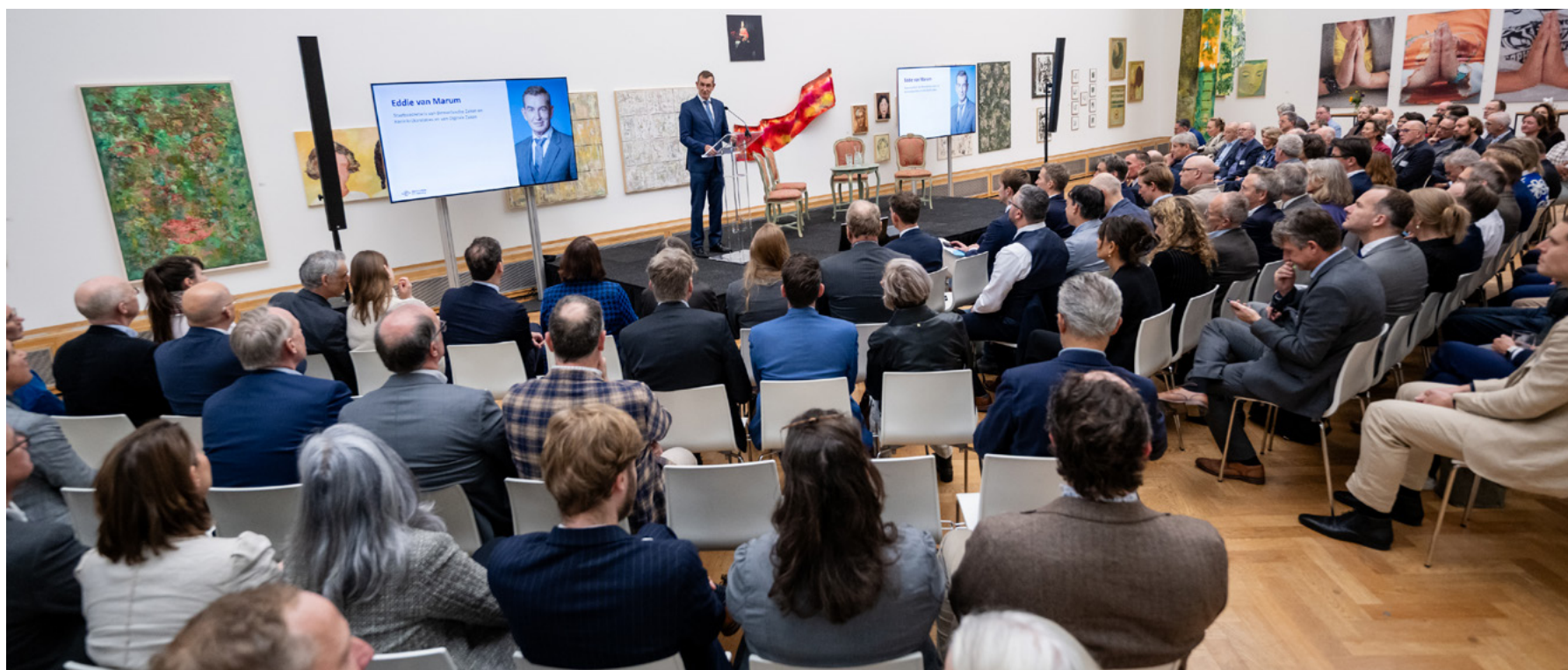
Staatssecretaris Eddie van Marum opent het symposium 'Betrouwbare ICT in een onzekere wereld.'

Belangrijke algemene lessen uit onze recente onderzoeken delen we sinds 2025 onder de noemer 'Inzicht uit onderzoek'. Hierin geven we praktische tips waarmee zaken die vaak verkeerd gaan, relatief eenvoudig kunnen worden